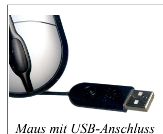
Maus mit USB-Anschluss

Netzwerkanschluss: für Zugang zum LAN bzw. Internet.